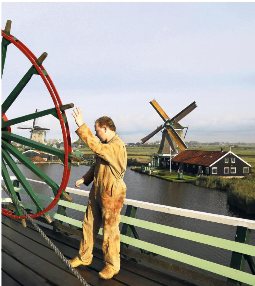
Zaanse Schans, molen De Kat. Met het wiel kunnen de wieken in de goede stand worden gezet: kruien.